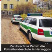
Zu Unrecht in Verhaftung: die Polizeischule in Herzogau

Nürnberg - Wende im „Sex-Skandal“ an der Polizeischule Herzogau (Bayern) Die in einem anonymen Brief behaupteten Missgeschickungen junger Polizistinnen (BILD berichtete) waren offenbar nur ein deftiger Partypaß. 15 der 16 Beamtinnen, die in den vergangenen Jahren ihre Ausbildung an der